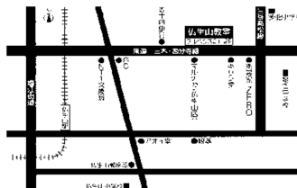
仏生山教室 仏生山町甲418 TEL:087-887-6000