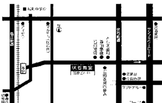
伏石教室 伏石町118番地 TEL:087-865-0600