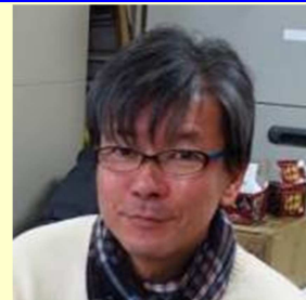
嬉野 雅道 (日本のテレビディレクター、プロデューサー、カメラマン、脚本家)

自分の人生を肩代わりしてくれる人なんかいないから、 懸命に自分でその辛い状況を乗り越えようとする。 それを繰り返す事が、 その人の人生を間違いなく豊かにしている。