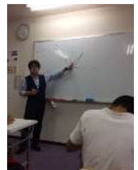
生徒に負けず、頑張る！