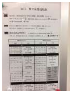
魔のスケジュール！