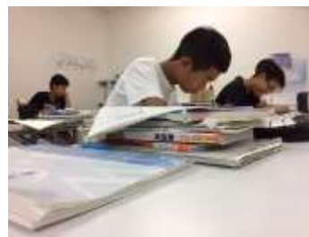
問題集を積み上げてできる山