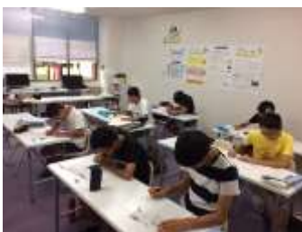
13時には中3が集まる！

玉藻教室 中3受験生は全員13時～19時で塾へ来ています。この時間内では学校の宿題をすることを最小限にし、塾の宿題や課題学習に取り組んでもらっています。また、集中力を高めるため途中30分程度の仮眠タイムもとっています。長く塾にいるだけでは？という保護者様の不安に対応すべく、「1日10個の良い質問をする」制度を作り、質問なき自習を廃するよう心がけています。内申点が決まる2学期の定期テストのために、受験校を決める診断テストのために、今が頑張り時です！ 結果はすぐに出ません。早めの準備が必要ですよ！